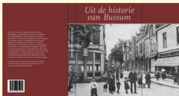
Omslag van het boek

Voor veel leden van de HKB gaat binnenkort een lang gekoesterde wens in vervulling: eind november verschijnt er een boek waarin een groot aantal artikelen uit onze bekende rubriek in 'Gooise Meren Nieuws' wordt gebundeld.