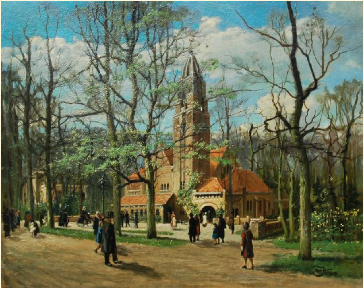
De Spiegelkerk omstreeks 1930. Schilderij van Olga van Iterson-Knoepfle